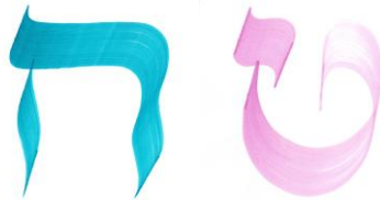
(Heith et Teith)

Heith et Teith, l'intégration du potentiel de vie, et ouverture au chemin de transformation. La relation au Tout-Autre.